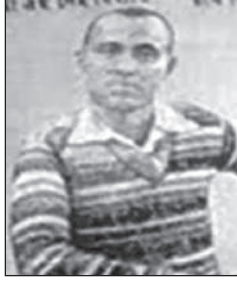
রামনাথ বিশ্বাস (১৮৯৪-১৯৫৫) বিশ্বপর্যটক ও লেখক জন্মস্থান: বানয়াচঙ্গ, শ্রীহট্ট